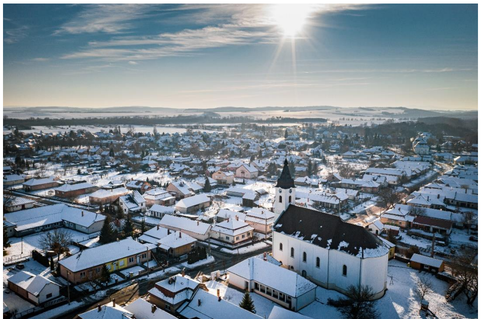
Farkas Dániel drónfelvétele a szügyi evangélikus templomról és környékéről a téli napsütésben

Az alkotások elkészítéséhez eredményes munkát kívánunk!