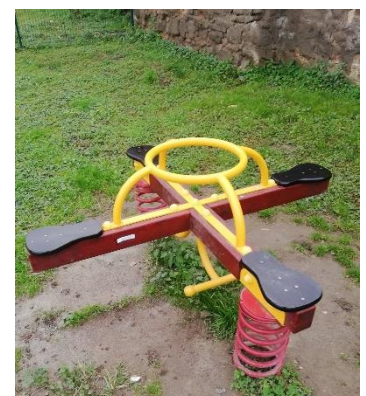
A megújult óvodai játszótér