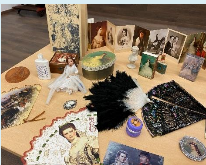
Az előadáson kiállított tárgyak