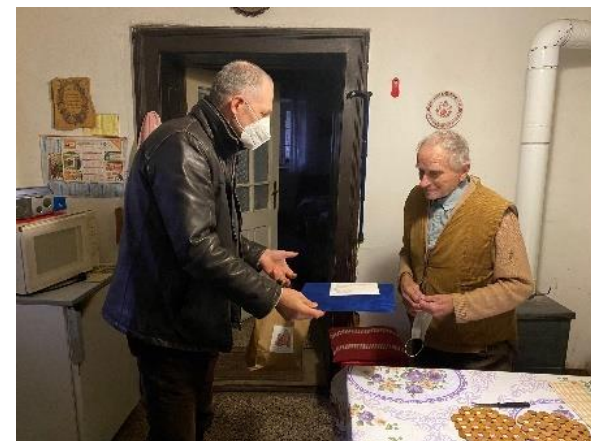
Frenyó Gábor polgármester személyesen köszöntötte Szügy község legidősebb nő és férfi lakosát