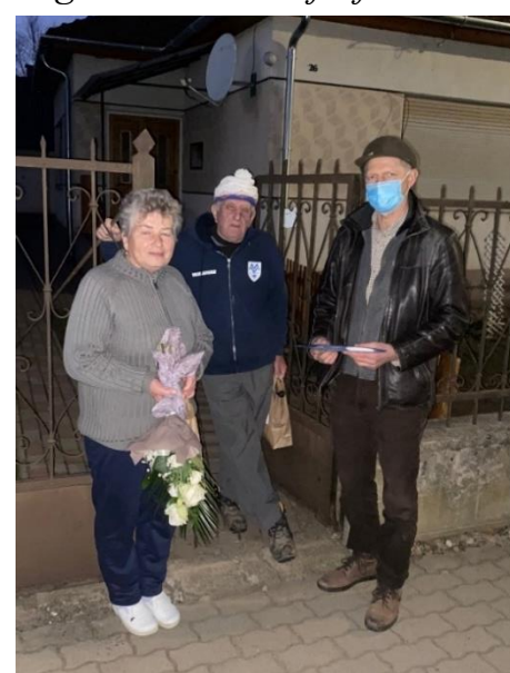
Az idén 50. házassági évfordulójukat ünneplőket köszöntötte a polgármester