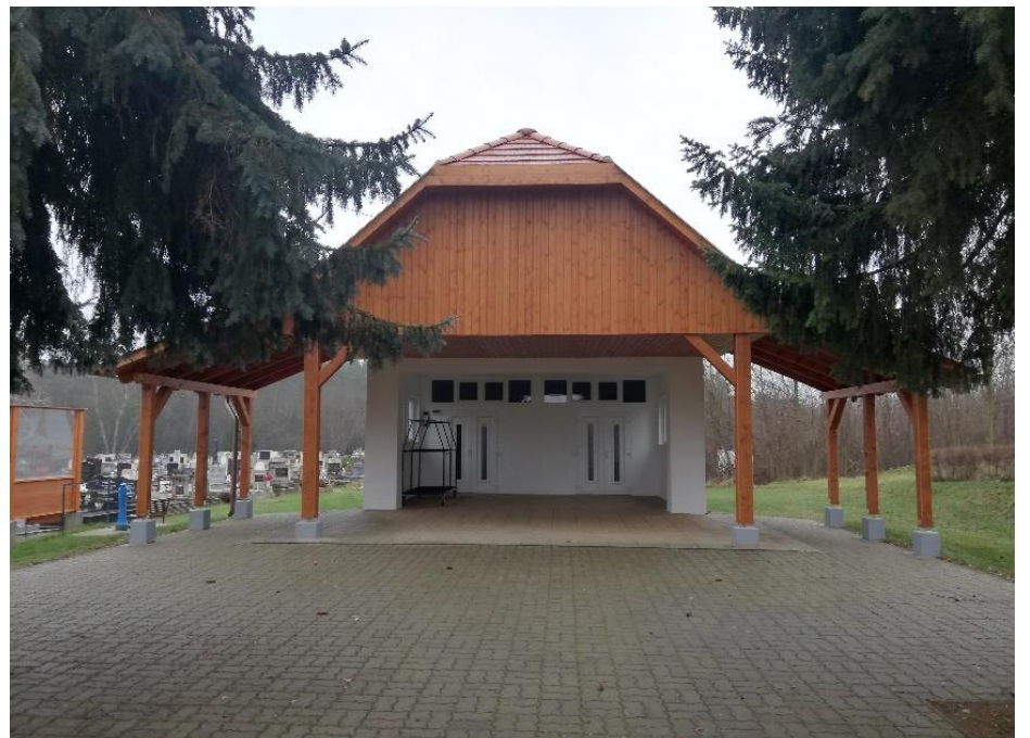
A ravatalozó, amely az Ipoly-menti Palócok Térségfejlesztő Egyesületnek köszönhetően pályázat keretein belül került felújításra